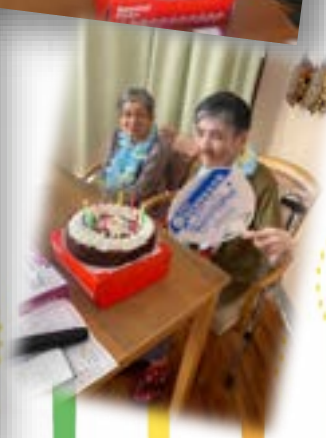
* 母の日父の日合同会