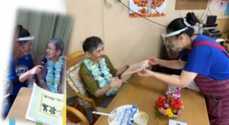
* 鯉のぼり 祭り